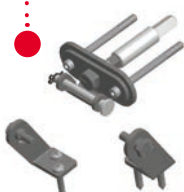
Abb.: Konsolensatz Farbausführung: grau

In Gehäusefarbe farbbeschichtete Edelstahlkonsolen für einfachste Montage an Fenstertypen der Roto® Serien designo R6 & R8 und Velux® Serien GGL & GGU, GHL & GHU, GPL & GPU geeignet