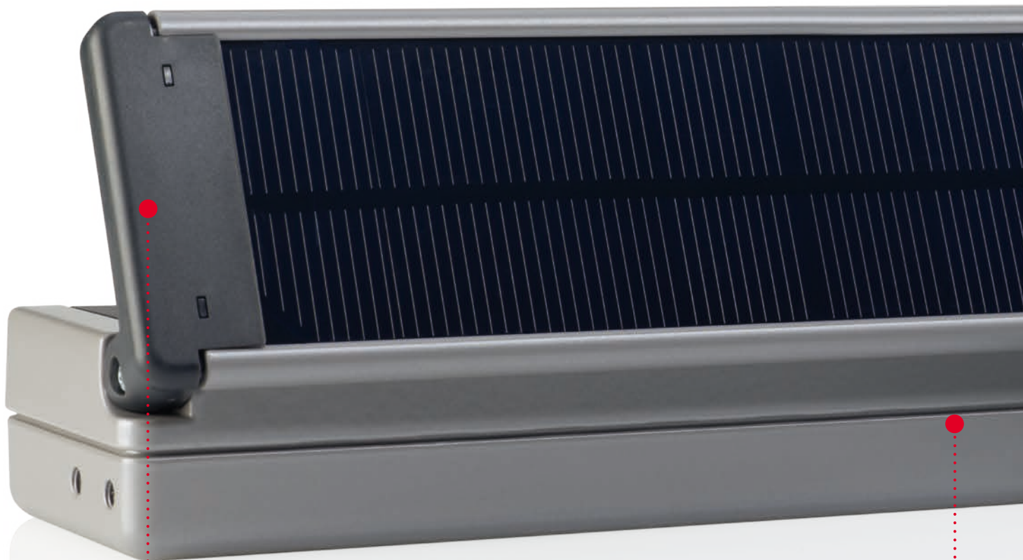
Abb.: Ventic-Solar im ca. - Maßstab 1:1 (380 x 44 x 65 mm) Farbausführung: grau

Da das aufklappbare, monokristalline Solarpanel direkt am Antrieb aufgesetzt ist, entfallen auch hier aufwendige Montage- und Verkabelungsarbeiten zwischen Solarmodulen und Antrieben – praktischer Handlingskomfort ist somit garantiert. Neben angenehmer Raumlufthygiene durch kontrollierte Lüftung mit möglicher Timerfunktion sorgt die im Ventic-Solar integrierte AES/128 bit Funkverschlüsselung für Schutz gegen Fremdbedienung. Durch sein schlichtes Design fügt sich der in verschiedenen Farbkombinationen erhältliche Ventic-Solar in jeden Wohnungsstil perfekt ein.